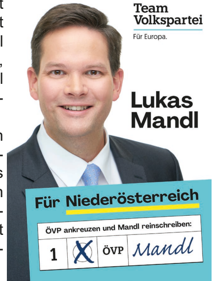
Team Volkspartei Für Europa.

Er will auch für ein solidarisches Europa kämpfen, das stark nach außen ist und die größtmögliche Freiheit nach innen gewährleistet.